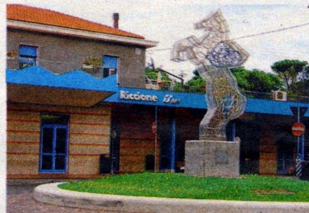
La stazione ferroviaria di Riccione